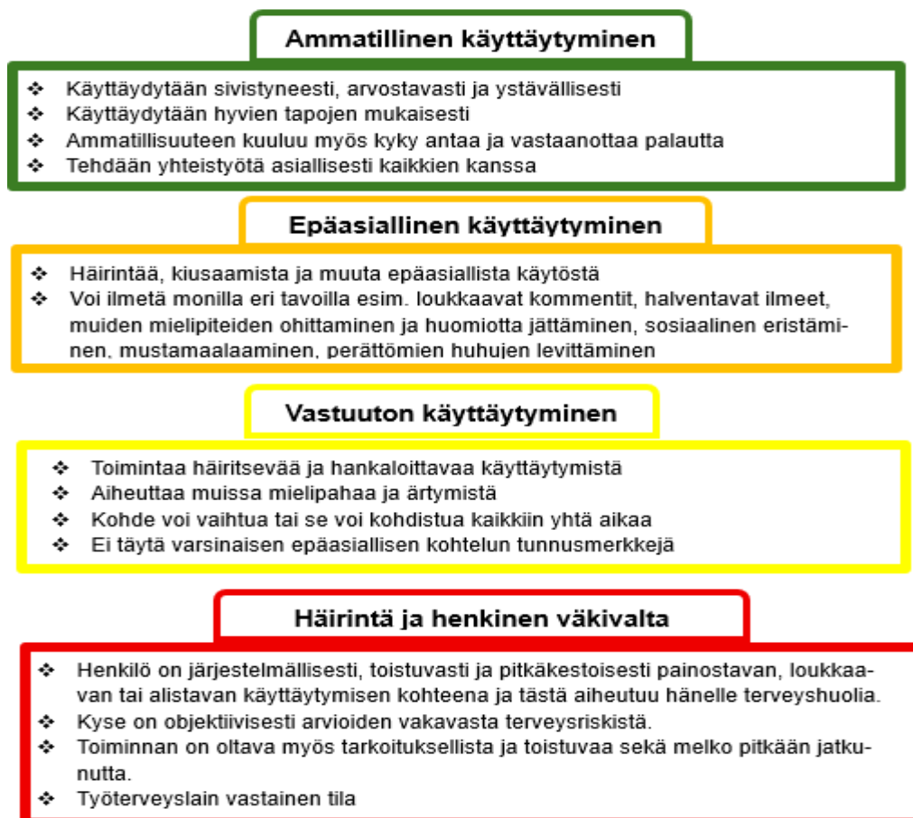
Kuvio 1. Käyttäytymisen aste-erot (lähde KT)

Ei toivottu käytös voi ilmetä monin eri tavoin: se voi kohdistua yhteen henkilöön tai ryhmään, olla kertaluontoista tai toistuvaa. Merkityksellistä on, että kaikkeen ei toivottuun käytökseen puututaan aktiivisesti kuhunkin tilanteeseen tarkoituksenmukaisella tavalla. On tärkeää, että esihenkilö on tietoinen, mikäli vastuutonta, epäasiallista käytöstä tai häirintää työyhteisössä on, jotta asiaan on mahdollista vaikuttaa. Työsuojelu auttaa mielellään olemalla tukena taustalla tai asian käsittelyssä konkreettisesti.